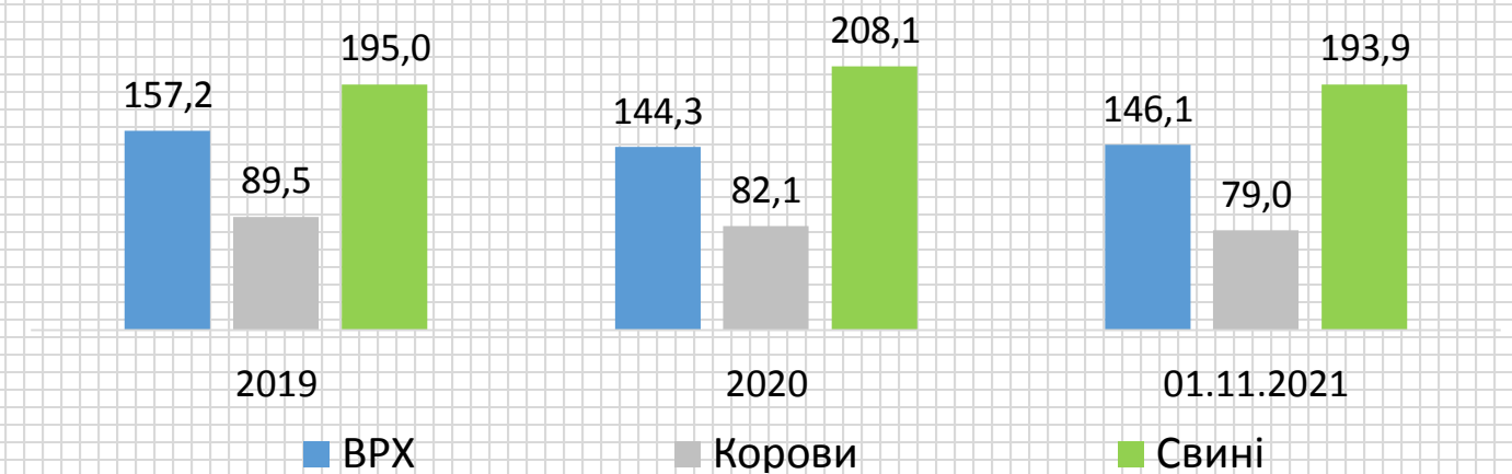
Кількість худоби на кінець року, тис. голів